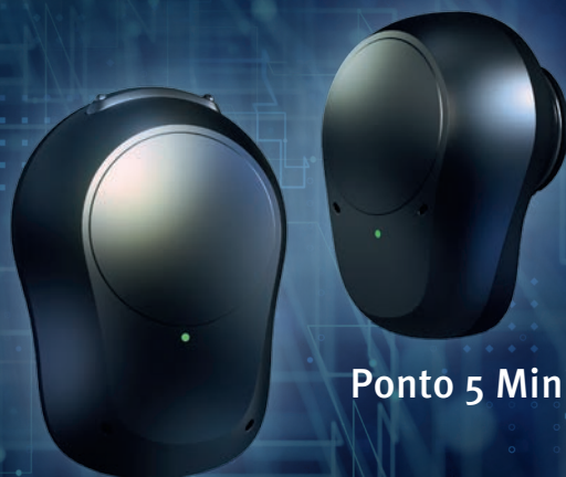
Ponto 5 Super Power

Tienes a tu disposición la última tecnología en implante Osteointegrado